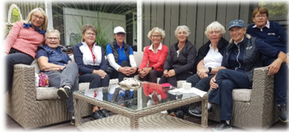
Vi som var med och spelade i Alingsås