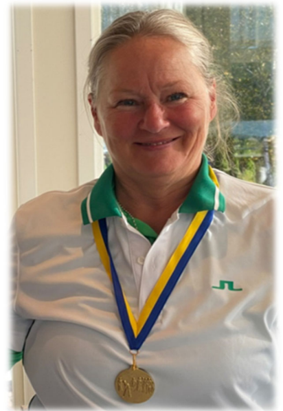
Samtliga vinnare från säsongen och dagen

Totalt deltog 65 st olika Bredaredsdamer i år.