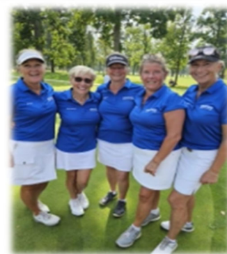
Lagbild från DM i Lidköping