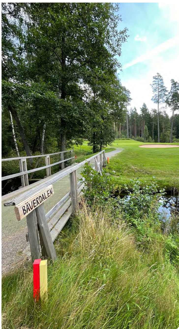
Den svenska bäverstammen ökar som mest i Västra Götaland.