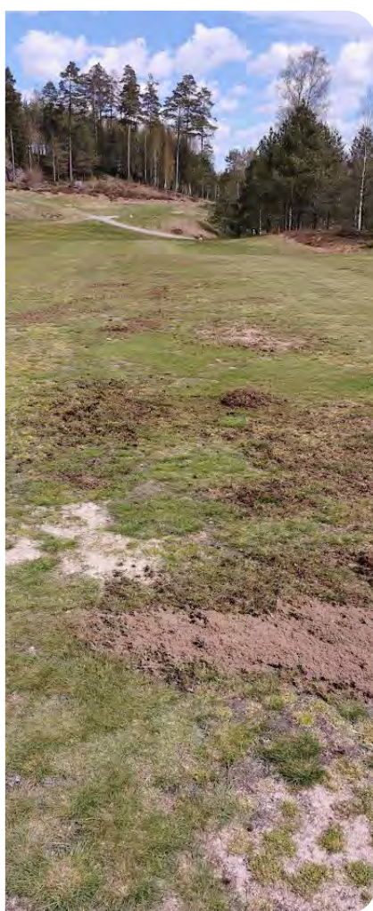
Fairway tar stryk av skyfall och torka.