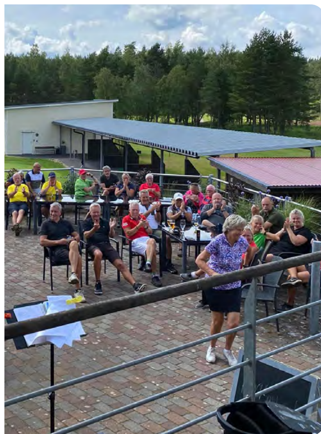
Golfweekend på Bredareds golfklubb 29 juli 2023.

Drivingrangen är tillgänglig med rullstol och själva golfbanan med golfbil.