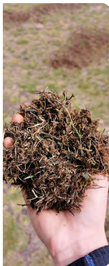
Och gräset dör.

behövs vid extrem torka. Fokus ligger på bevattningsav greenerna. Torkan i juni 2023 påverkade banans skick under fyra månader, juli – oktober, med lägesförbättring på den finklippta delen av spelfältet.