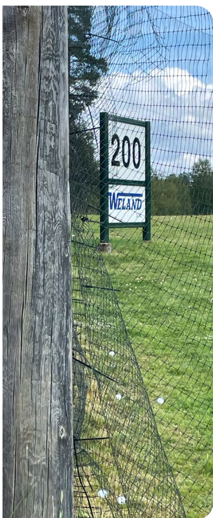
Nätet på rangen tar stryk av vinden.