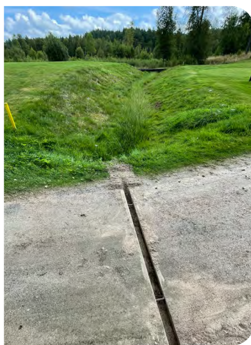
Vatten leds bort från gångväg.

För dricksvatten finns en djupborrad brunn i anslutning till klubbhuset. Den kommer att kompletteras med en vattenmätare under 2024.