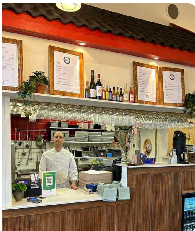
Bredareds golfkrog i ny tappning och med ny krögare.

Med hjälp av frivilliga krafter och egna medel genomgick restaurangen en stor förvandling under vintern. Fler platser, en varmare atmosfär och helt nya menyer ska locka fler gäster till Bredareds golfkrog.