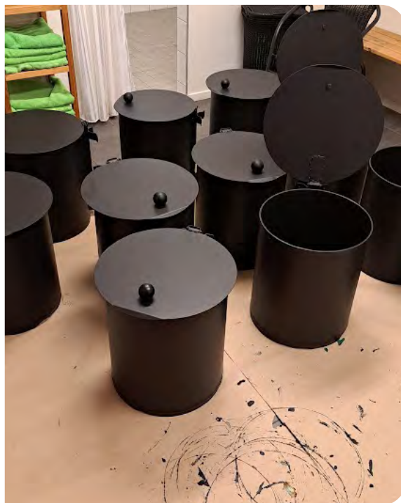
Gamla soptunnor blir som nya efter uppfräschning.