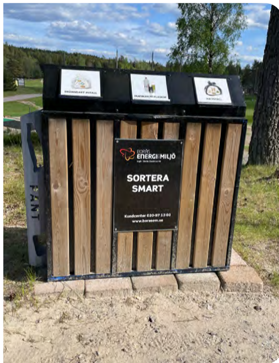
Sorteringsstationer för fler fraktioner för att öka återvinningen.

Inför säsongen 2024 har även övriga soptunnor blivit reparerade och uppfräschade.