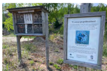
Det finns flera insekts hotell längs banan.

2021 genomfördes en GIS-analys över kända naturvärden på golfanläggningen av Örnborg Kyrkander Biologi & Miljö.