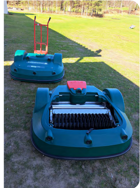
Piff och Puff. Robotarna har redan fått sina smeknamn.